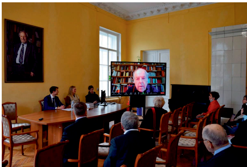
Профессор Берлинского технологического университета, член-корреспондент Международной академии истории науки Э. Кноблах выступает на Круглом столе памяти Э.И. Колчинского. 16 сентября 2021 г.