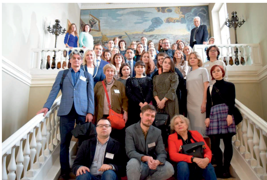
Участники VIII Научной школы молодых учёных ИИЕТ РАН на экскурсии в Санкт-Петербургском научном центре Российской академии наук. 17 октября 2022 г.