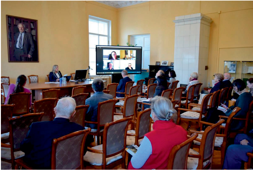
Открытие XLIII Международной научной годичной конференции Санкт-Петербургского отделения Российского национального комитета по истории и философии науки и техники Российской академии наук «Академия наук и научные центры союзных республик (к 100-летию образования СССР)». 25 октября 2022 г.