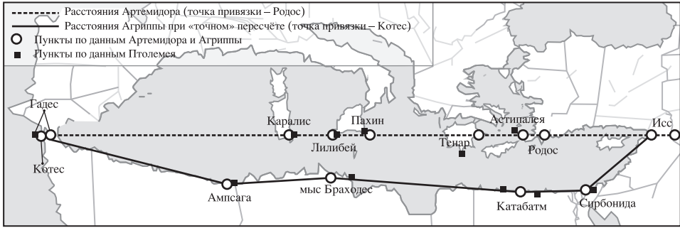
Рис. 2. Сведения Артемидора и Агриппы в сравнении с картой Птолемея

Всего 26\ 220^{73} = 65,55^\circ против 64\frac{1}{3}^\circ у Птолемея. Страбон 74 : Исс – 5000 – Родос – 1000 – Салмоний – 2000 – Криуметоп / Тенар – 4500 – Пахин – 1000 – Сицилийский пролив 75 – 12 000 – Столпы – 800 – Гадес. Всего 26\ 300 = 65,75^\circ против 64\frac{1}{3}^\circ у Птолемея. Отметим, что данные Артемидора и Страбона неплохо согласуются с картой Птолемея (см. рис. 2 и 3) 76 .