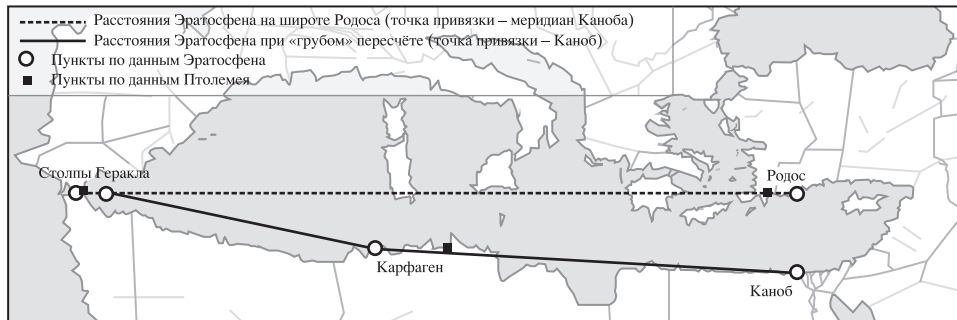
Рис. 1. Сведения Эратосфена в сравнении с картой Птолемея

Эратосфен (ссылки см. выше) оценивает интервал между меридианами Столпов и Каноба / Родоса в 21 500 стадиев = 53\frac{3}{4}^\circ на широте Родоса против 53\frac{1}{4}^\circ у Птолемея (если за точку отсчета взять меридиан Каноба, см. рис. 1) и 35^\circ 16' в действительности 65 . Агриппа дает от Гадесского пролива до Исса 3440 м. р. = 27 520 стадиев = 68\frac{4}{5}^\circ против 64\frac{1}{3}^\circ у Птолемея и 42\frac{1}{2}^\circ в действительности (если за точку отсчета взять Гадес / Кадис) 66 .